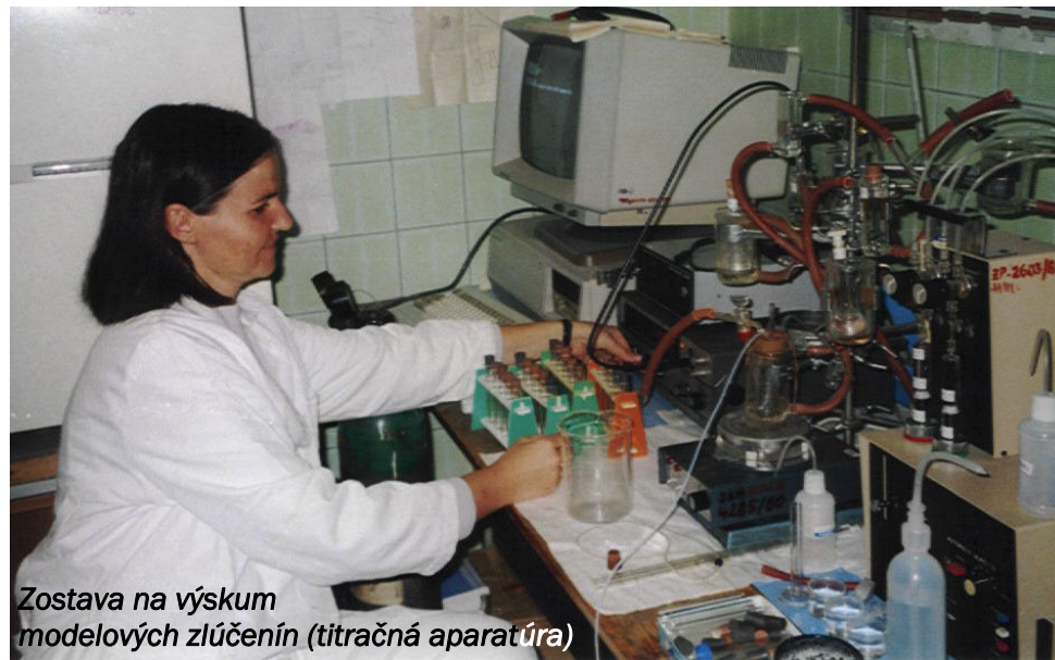
Zostava na výskum modelových zlúčenín (titračná aparatúra)

rozmyšľajú, ako si prácu zjednodušiť. V Košiciach som však prežila väčšinu svojho doterajšieho života, vraciam sa tam každý deň a vždy rada.