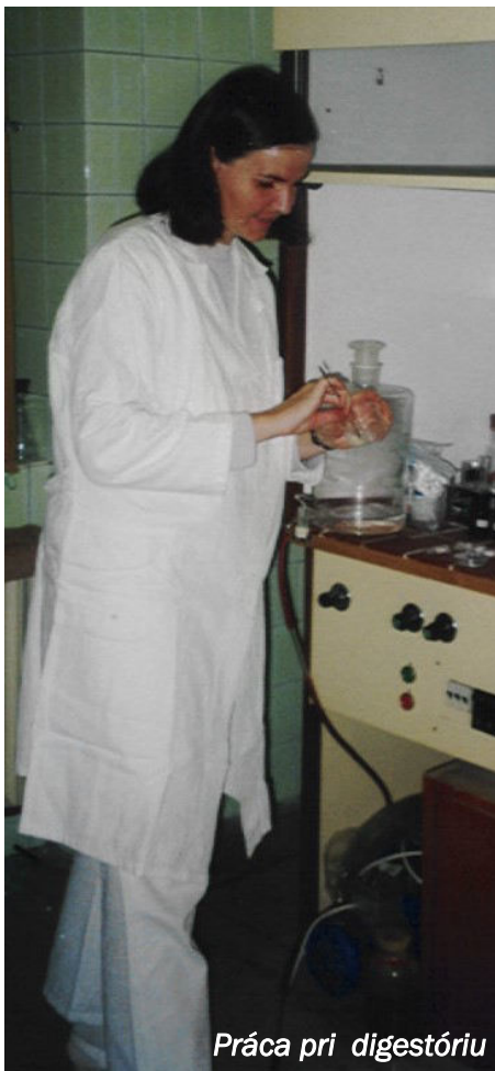
Práca pri digestóriu

- Situácia dnešných rodín nie je veľmi priaznivá. Náš príchod do Hodkoviec bol motivovaný nedostatkom finančných prostriedkov na kúpu bytu. Prestavbu starého domu sme uskutočňovali postupne, takže nebola potrebná jednorazová veľká suma na jej realizáciu. Postupne sme dom dali do poriadku a upravili sme ho tak, aby nám vyhovoval. Okrem toho manžel pochádza zo susednej dediny, takže jeho príchod sem bol aj príchodom do jeho detstva.