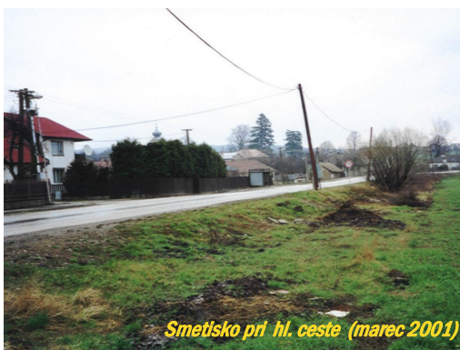
Smetisko pri hl. ceste (marec 2001)

anonym: Uznávam, že nie sú financie, ale mohlo by sa tam niečo urobiť, lebo o niekoľko rokov sa tam budú stavať domy.