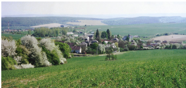
Pohľad na Hodkovce (apríl 2000)

V tomto čísle si priblížime mená a priezviska, ktoré sa v Hodkovciach vyskytovali.