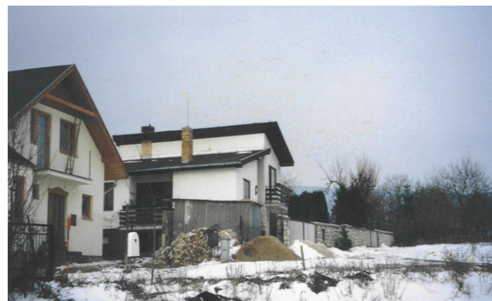
Pohľad na východnú ulicu našej obce (február 2001)