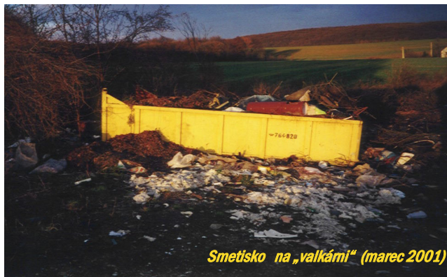
Smetisko na „valkárni“ (marec 2001)

Na Slovensku ako aj v Hodkovciach je to tak, sami si vyrábame odpady, ktorých sa chceme zbaviť, že ich sypeme tam, kde je nám najbližšie. Jedným slovom je to tak, že máme smetiarsku okrasu