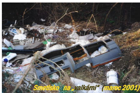
Smetisko na „valkárni“ (marec 2001)

okolo celej dediny. Určite nikto z nás nechce, aby sa r a z z Hodkoviec stalo veľké smetisko. Musíme si uvedomiť, že n e m ô ž e m e sypať odpady napríklad do priekop okolo hlavnej cesty alebo jednoducho tam, kde sa nám to páči. To, ako vyzerajú naše ulice, je vizitka nás všetkých, nielen Ocu a smetiarov. Ľudia, ktorí prechádzajú cez Hodkovce, si takéto veci všímajú a určite si nevytvárajú o dedine najkrajšiu mienku. A hlavne o jej obyvateľoch. To sa určite nikomu z nás nepáči. Čím skôr proti