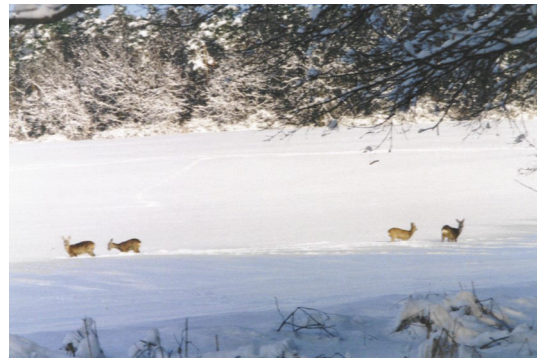
Pod lesom (február 2000)