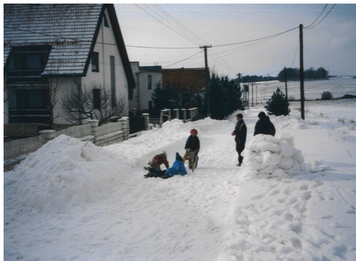
Záveje na ulici pod lesom

Zima sa chýli ku koncu a s pomalíčkou prichádzajúcou jarou sa začínajú staronové problémy. Veď každý z nás to určite veľmi dobre pozná. Na poliach, uliciach a dvoroch sú zvyšky snehu, ktorý sme si tento rok ani poriadne neužili. Avšak v niektorých častiach našej obce