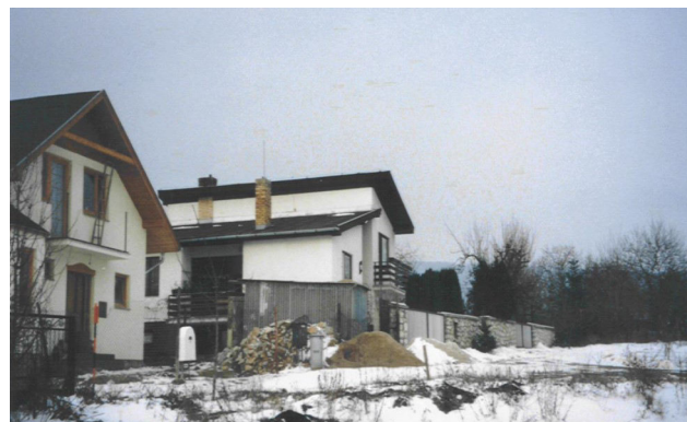
Pohľad na východnú ulicu našej obce (február 2001)