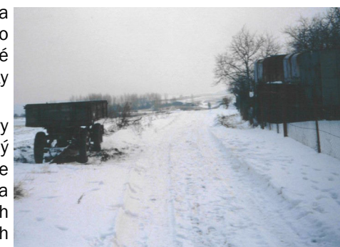
Pohľad na východnú ulicu (február 2001)

Tieto úpravy má Obecný úrad v pláne v jarňoch a letných mesiacoch tohto roku.