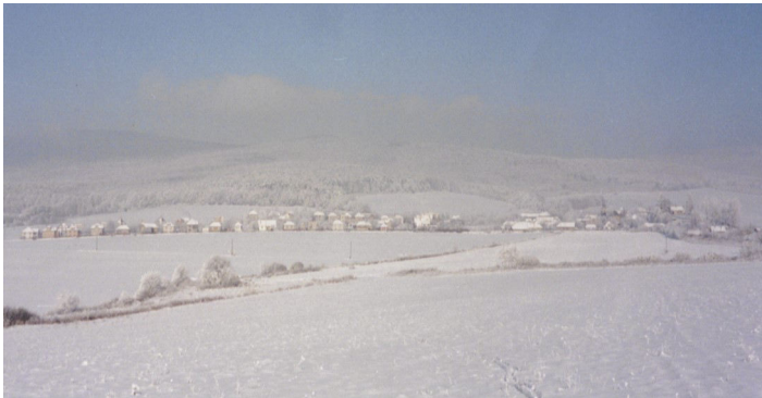
Pohľad na Hodkovce (december 1999)

Názov je slovanského pôvodu a pochádza od slovanského osobného mena Hodek. Hneď od začiatku sa vyvinul už so slovanským sufixom (predponou), a to najprv pri názve potoka ako Hodkov, potom pri dedine ako Hodkovce.