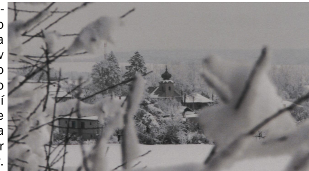
Pohľad na Hodkovce (december 1999)

Hatkovec. Slováci v 18. až 19. stor. nazývali Hodkovce v samej dedine ako Hatkovce, čo značí, že názov neprešiel prirodzeným vývinom v slovenskej reči a že v Hodkovciach bola pretrhnutá - čo aj len na krátky čas - kontinuita pôvodného slovenského obyvateľstva a Slováci teda prevzali názov späť z maďarčiny. Bolo to niečo podobné, ako sa to stalo s názvom Vajkoviec v údolí Torysy. Dedinu Vajkovce založili Slováci. Volala sa pôvodne Vajkovce, ale neskôr sa pomaďarčila a v 16. stor. vystupuje ako prevažne maďarská dedina. Vajkovce sa však od 18. stor. znovu poslovenčili a v lexikóne z r. 1773 vystupujú už ako slovenská dedina, ako dedina, v ktorej sa prevažne rozprávalo po slovensky.