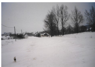
Záveje pred Hodkovcami

kanalizáciu a vodovod. Pýtate sa, prečo tento plán? V roku 1850 žilo v