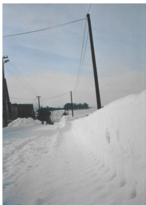
Záveje na ulici pod lesom

Hodkovciach asi 270 ľudí. Dnes je tento stav, žiaľ, podobný. Ak by sa v našej obci začalo s výstavbou nových ulíc a rodinných domov, čo je hlavnou myšlienkou tohto projektu, odstránili by sa problémy, ktoré sužujú obyvateľov oboch ulíc. Na základe výstavby by sa do Hodkoviec prisťahovalo viac ľudí, zvýšila by sa nielen